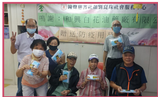
疫情期間，中心會員仍得到社區支援，如和興白花油藥廠有限公司捐贈防疫用品，與會員共渡難關