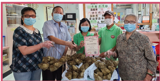
6 月份疫情和緩時，「愛心全達」送贈愛心粽給長者共渡端陽

期望新冠疫苗能普及世界各地市民注射需要，讓各國經濟及活動重回正軌，香港市民重過正常生活，盡快恢復中心運作，繼續為會員及同區長者提供日間護理服務需要，並舒緩家屬 / 護老者照顧長者壓力。