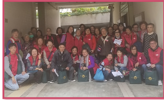
在疫情和緩時，老中青義工進行「攜手探訪展關懷」為區內長者獻上關懷慰問

回應社區需求，來年我們會繼續關注認知障礙症患者及其護老者，為他們提供適切的訓練和支援。在新常態下，我們亦會協助會員提升網絡应用能力，以科技突破環境的界限，使他們安坐家中，亦可參與活動，以及和親友聯繫。疫情影響下，長者心靈會少不免會受影響，故此，來年我們會重點關注他們心靈健康，加強慰問和探訪工作，務使長者在逆境下仍感受到暖意。