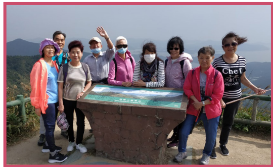
歷奇新天地帶領學員增廣見聞，登上飛鵝山顛，讓廣闊景色盡洗疫情陰霾