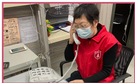
疫情下社交活動減少，中心義工致電長者及護老者，讓他們與中心保持聯繫，同時了解他們的需要，讓社工能提供適時適切的服務予他們