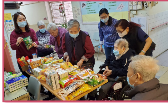
舉辦市集活動讓院友選購，一抒悶氣

護理方面，本年 11 月安排全院院友及職員注射流感針。12 月份由院舍的感染控制主任舉行二次的感染控制培訓給各職級職員參與，加強職員對感染控制的認識。