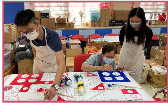
長者參與由東華三院柏悅長者優質照顧服務站協辦的「巨型飛行棋」，既舒展身心，亦可提升記憶力

中心來年會繼續舉辦及參與多元化的活動，鼓勵長者多參與社區活動及義務工作，以望回饋及服務社會。同時，為配合中心認知障礙症服務及減輕因疫情帶來的影響，中心計劃於來年推廣 IT 資訊的活動，由 IT 大使教授更多的長者學習數碼科技，擴闊他們的社交網絡及提升自信心。另外，因著數碼科技帶來的便利，期望可為有需要的認知障礙症長者、護老者提供訓練及支援（例如感官系統、記憶力訓練、線上支援系統），以舒解護老者照顧壓力，也讓長者活得豐盛。