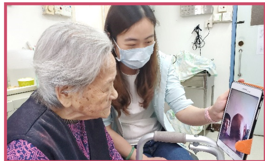
院友及家人可透過視像互相慰問傾訴

院舍方面，已按安老院牌照事務處指示制訂院舍內如有住客或職員感染「新型冠狀病毒病」的緊急應變計劃。3 月份舉行「認識新型冠狀病毒病」講座給職員參加，讓各職級職員了解一切預防措施。7 月份安排全院噴灑抗病毒塗層，以及在樓上及樓下飯堂飯桌上加設分隔板。由於禁止外來義工到院舍為院友剪髮，故安排由職員親自為院友剪髮，以保持儀容及整潔。