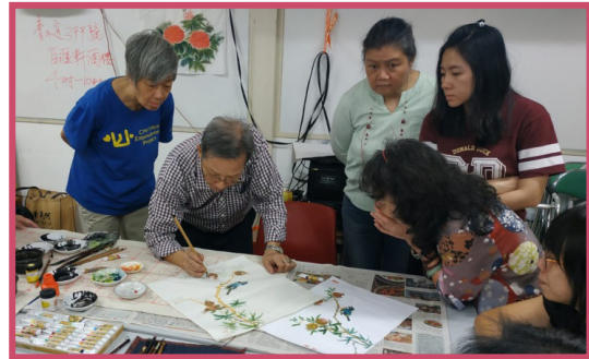
透過鐘聲學院水墨畫班，學員發展個人興趣，從終身學習中提升能力，有助增強自我認同，保持活力

由於疫情影響及員工不足，活動減少，以致會員人數漸漸流失，希望疫情減退後，隨著中心恢復正常服務，能夠吸引更多區內居民參加，讓會員人數重登巔峰。然而仍需參照社區環境變遷，如疫情在來年仍繼續在深水埗區蔓延擴散，將會嚴重影響中心日後開展服務的進度。