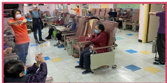
在限聚令及防止感染措施下，舉行集體體操，增強長者身體抵抗力