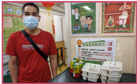
蒙香港賽馬會贊助的飯盒援助計劃，讓中心與受疫情影的人士或家庭逆境同行，共同抗疫