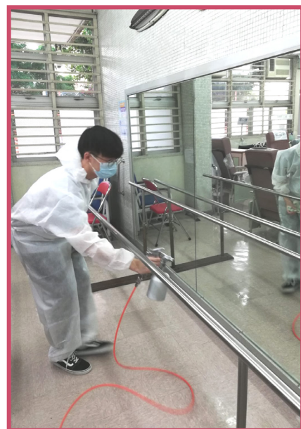
中心及兩部復康小巴均噴灑防病毒塗層，保持會員、職員健康