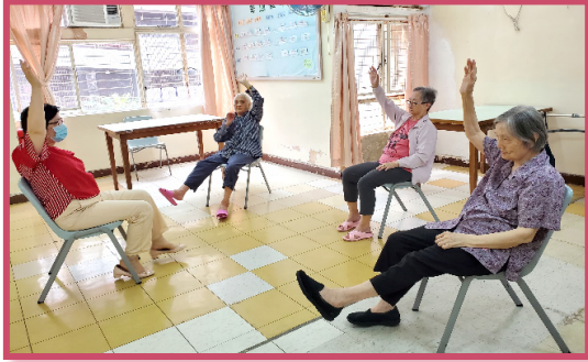
小組聚會開放保持 1.5 米距離

聖誕節期間，舉行聖誕市集活動，由職員預備一批各式各樣院友喜歡的零食讓院友在院舍內購買，令院友未能外出亦可享受購物之樂趣。