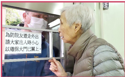
院友與家人可隔著玻璃門傾談

為保障院友健康，由 2 月 3 日起院舍暫停家屬探訪，5 月中起實施有限度探訪，直至第三波疫情開始，院舍按社署指示全面暫停探訪，在此期間，院舍提供視像通訊供家屬聯絡院友，讓院友可透過視像對話與家人聊天，感受家人的關懷愛護。