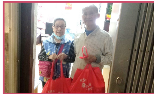
「寒冬送暖」活動，由義工送贈禦寒物資、禮物包予區內長者，使長者們不因氣候寒冷或限聚令而感到與社區隔閡