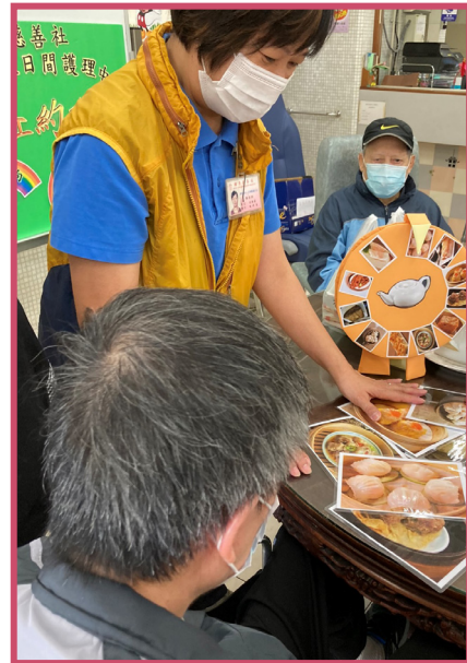
中心提供「認知訓練」予長者會員，啟發思考，延緩腦部退化

另外，中心會繼續加強員工對防感染控制之培訓，並定時作考核。中心來年會繼續提供相應的小組活動治療，希望能減慢認知障礙症患者之腦退化及可改善其日常生活之素質。同時，繼續安排健康講座，以提昇照顧長者之知識及技巧，從而提昇服務質素。