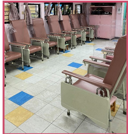
每一座位兩邊均增設透明膠板作為預防及隔離措施