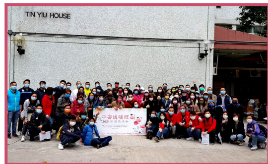
義工探訪獨居長者、兩老及體弱長者，送上愛心福袋，受惠長者感到社區人士關懷溫暖