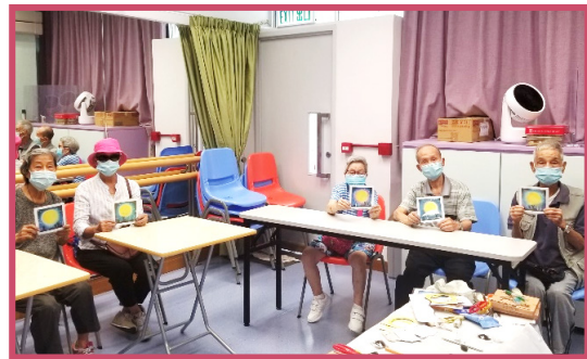
長者會員透過「智」趣粉彩齊齊畫，塗寫心情，紓緩情緒