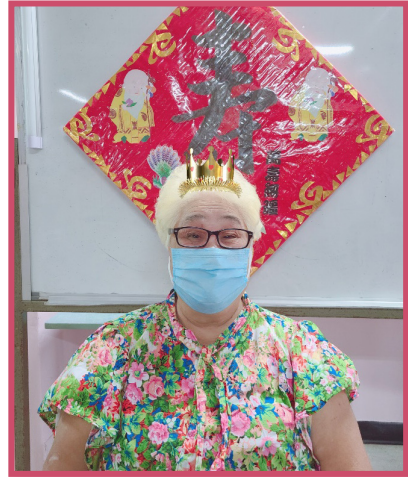
疫情和緩時，中心為長者舉行生日會慶祝壽辰

其他：為加強抗疫清潔，中心除日常環境清潔消毒外，於 9 月份已為全中心及兩架復康小巴噴灑塗層消毒，12 月份每一座位兩邊增設透明膠板作為預防及隔離措施之用，長者對此表示感覺良好及安全。