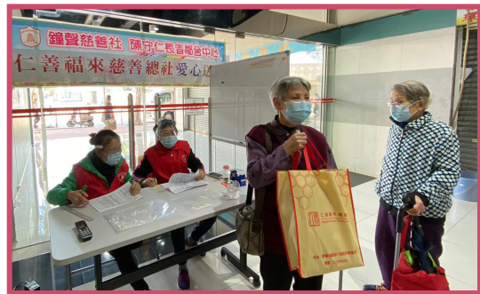
「仁善福來慈善總社」送贈 280 件羽絨予中心有需要長者，寒冬送暖