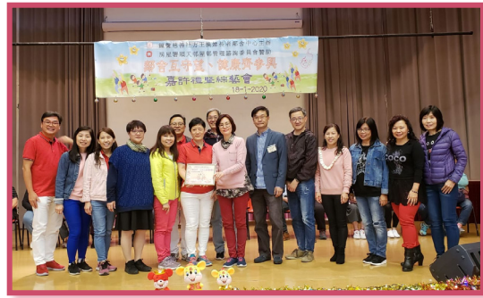
『鄰舍互守望、健康齊參與』社區計劃嘉許暨綜藝會

來年將延續地區合作，結合數十年來區內友好團體合作，將更多服務推廣到社區中，並結合來自不同年齡區域、跨年代的義工做到最好，從不鬆懈。來年也配合長者需要，向地區申請基金及資源，推動義工為長者服務發光發熱，再放異彩。