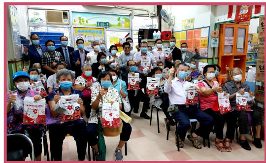
端午愛心抗疫活動—長者會員參加中醫抗疫講座，學習中醫防疫方法，獲贈防疫包，均表示獲益良多