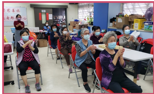
中心長者齊做體操，一起伸展筋骨